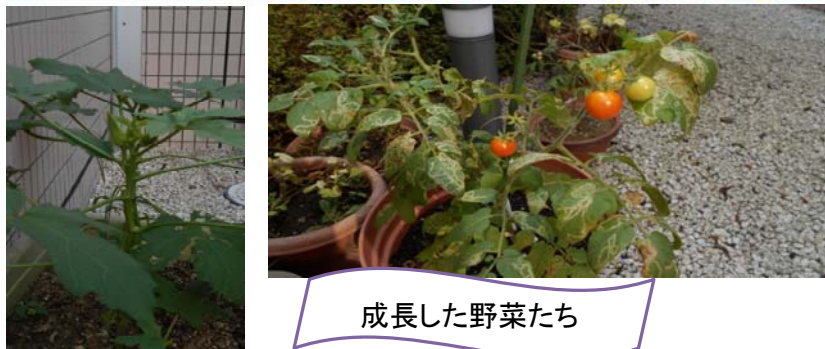
成長した野菜たち