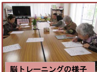
脳トレーニングの様子