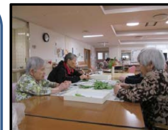
さやえんどうのすじ取りの様子