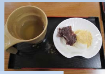
安倍川風おはぎ作り