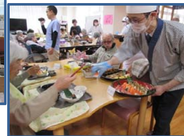
5月3日は出張で板前さんが来てくれました。大好きなお寿司をたくさん食べてご満悦でした。