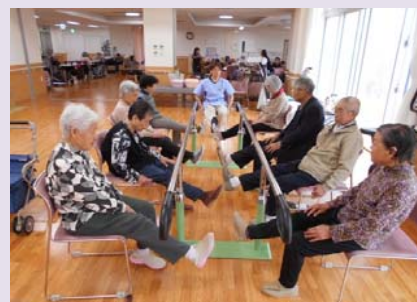
下肢筋力強化運動